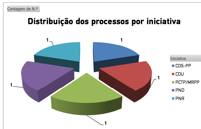
Gráfico n.º 3

Apresenta-se de seguida a distribuição dos processos instaurados por tema a que os mesmos respeitam. Verifica-se que o único tema com dois processos é o do tratamento jornalístico.