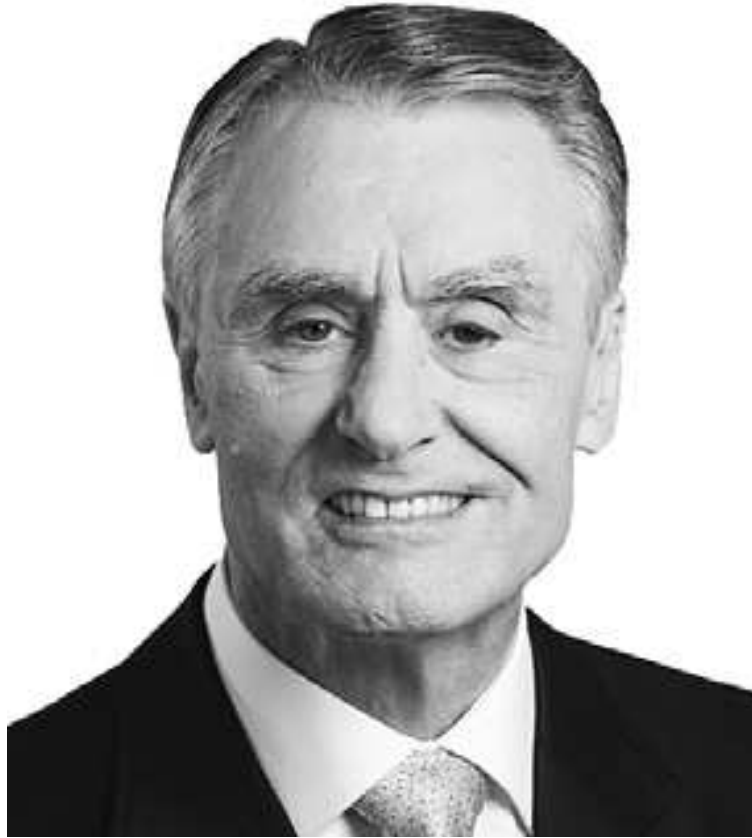
Aníbal António Cavaco Silva