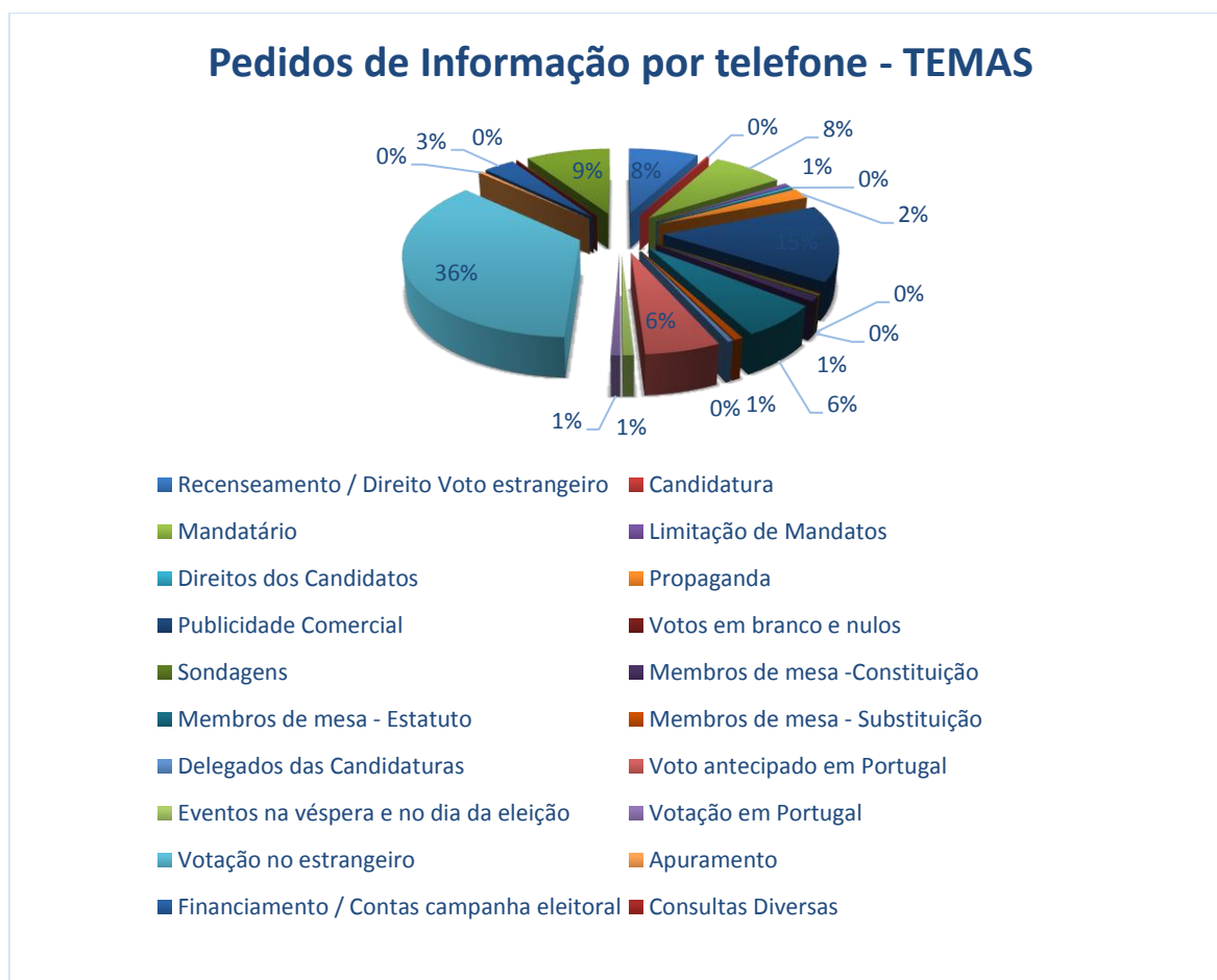
Fig. n.º 2